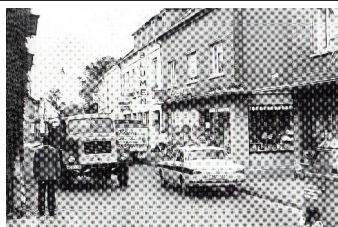
1964 Ortsdurchfahrt Vluyn

Haben Sie auch etwas gefunden, was nicht in Vergessenheit geraten sollte? Melden Sie uns Ihre Entdeckung unter info@hvv-vluyn.de oder sprechen Sie uns z.B. beim nächsten Stammtisch direkt an. Gemeinsam überlegen wir dann, wie wir Ihren Fund präsentieren.